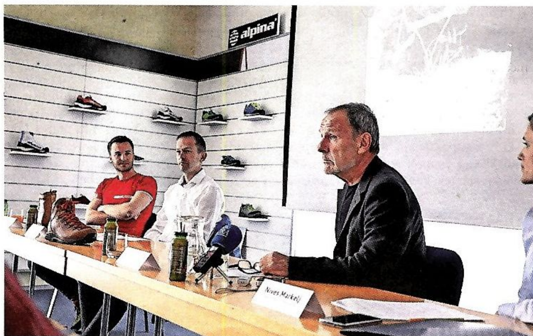
Alpinim gojzarjem že več kot štirideset let ostaja zvest tudi eden najbolj znanih slovenskih alpinistov Viki Grošelj.

Alpinim gojzarjem že več kot štirideset let ostaja zvest tudi eden najbolj znanih slovenskih alpinistov Viki Grošelj. »Če pretiravam, sem se rodil z Alpinimi čevlji na nogah,« se pošali. Kot pravi, si brez teh čevljev včasih niti ni bilo mogoče zamišljati gornišstva. V šestdesetih in sedemdesetih letih prejšnjega stoletja so Alpinine čevlje uporabljali tako planinci kot alpinisti. »Vse smo počeli v istih čevljih – plezali, hodili in celo smučali,« se spominja